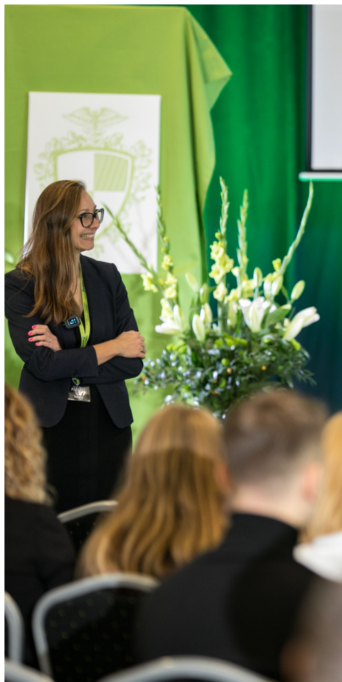
Jedna z inauguracyj Studiów Licencjackich ASBiRO

Każdy rocznik ma przypisanego Opiekuna, którego zadaniem jest dbanie o każdego studenta jak o najlepszego klienta (a nie petenta) i asystowanie mu w trakcie trwania studiów oraz podczas sesji.